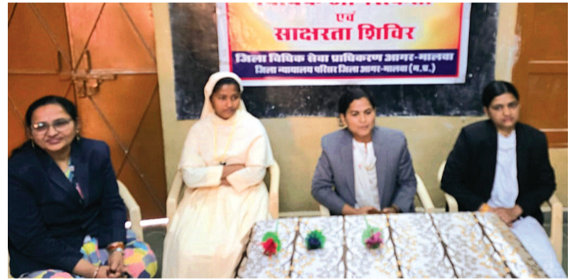
जानकारी, अधिकारों की समझ तथा सुरक्षा के प्रति सजगता बढ़ी।