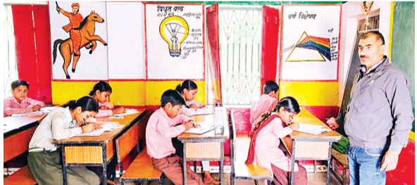
हरिभूमि न्यूज़ | ललितपुर