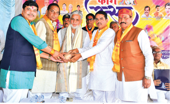
नलखेड़ा