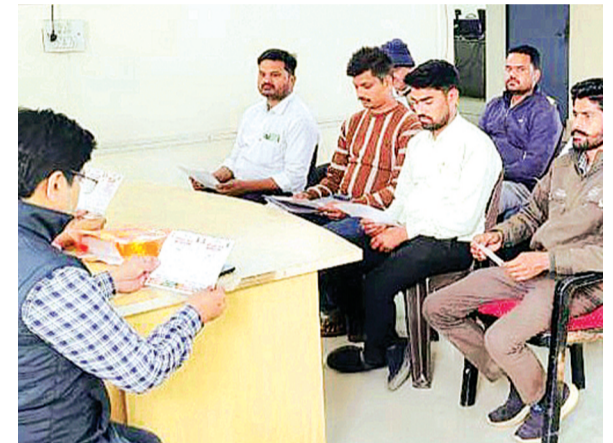
हरिभूमि न्यूज़ | ललितपुर

परिवहन विभाग द्वारा लघु अवधि की श्रेणी के अंतर्गत एकमुश्त कर ढांचे के लागू होने के बाद एआरटीओ स्तर पर परिवहन कार्यालय में दो दिवसीय परिवहन मेले का आयोजन किया गया। यह मेला 20 व 21 फरवरी को सुबह 11 बजे से शाम 4 बजे तक आयोजित हुआ, जिसमें बड़ी संख्या में वाहन स्वामियों और आम नागरिकों ने भाग लिया। मेले में एआरटीओ (प्रशासन) तथा यात्री/मालकर के अधिकारियों ने उपस्थित वाहन स्वामियों को व्यवसायिक वाहनों के एकमुश्त कर भुगतान एवं समायोजन से जुड़ी समस्याओं के समाधान के लिए जागरूक किया। अधिकारियों ने बताया कि इस व्यवस्था का उद्देश्य कर प्रक्रिया को सरल बनाना और वाहन स्वामियों को त्वरित सुविधा उपलब्ध कराना है। कार्यक्रम के दौरान एकमुश्त कर व्यवस्था से संबंधित नियमों, कर निर्धारण की प्रक्रिया, कर गणना, भुगतान की विधि तथा समय-सीमा के बारे में विस्तृत जानकारी दी गई। साथ ही मेले में आए वाहन स्वामियों की समस्याओं का मौके पर नियमानुसार समाधान भी किया गया। परिवहन विभाग के अधिकारियों ने बताया कि इस प्रकार के मेले आगे भी आयोजित किए जाएंगे, ताकि अधिक से अधिक वाहन स्वामी इस जनहितकारी योजना का लाभ उठा सकें।